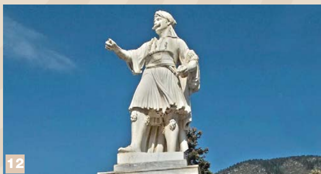
12. Ο Αγωνιστής του 1821 Δημήτρης Στριφτόμπολας

18:00 μ.μ: Διαδικτυακή συζήτηση της Ένωσης Καλαβρυτινών Αθήνας, στα πλαίσια του διαλόγου «Καλάβρυτα - Τουρκοκρατία - Εθνικοαπελευθερωτικός Αγώνας – Τα χρόνια που ακολούθησαν και θα ακολουθήσουν».