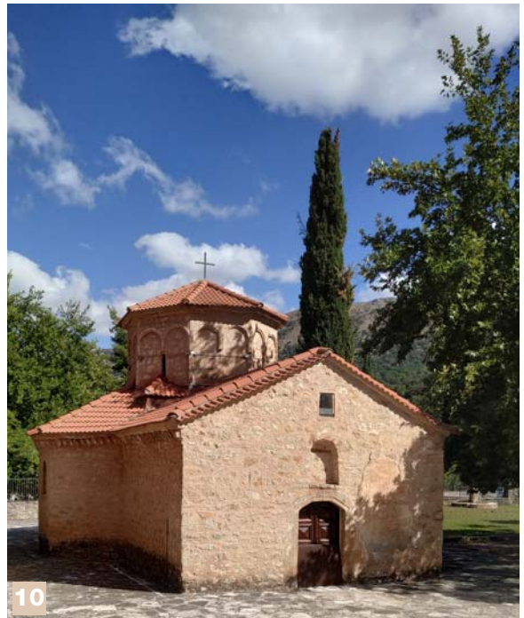
10. Ιστορικό Καθολικό της Μονής Αγίας Λαύρας 11. Αναπαράσταση Ορκωμοσίας των Αγωνιστών και κήρυξης της Επανάστασης του 1821, Θεατρικός Όμιλος Καλαβρύτων «ΠΑΝΟΣ ΜΙΧΟΣ»

11:50 π.μ: Αναπαράσταση Ορκωμοσίας των Αγωνιστών και κήρυξης της Επανάστασης του 1821 από το Θεατρικό Όμιλο Καλαβρύτων «ΠΑΝΟΣ ΜΙΧΟΣ».