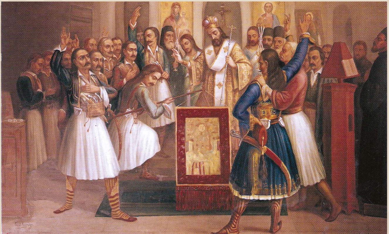
Ο Όρκος των Αγωνιστών του 1821