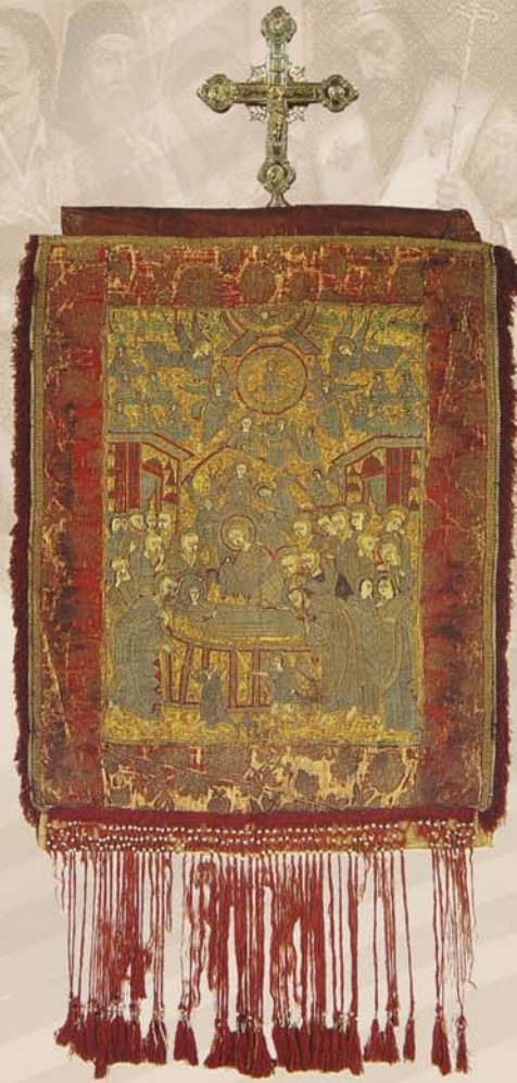
Το Ιερό Λάβαρο της Επανάστασης του 1821

«Ορκιζόμαστε, να πολεμήσουμε και να δώσουμε το αίμα μας για τη πατρίδα. Και ή να ελευθερωθώμεν ή να αποθάνωμεν.»